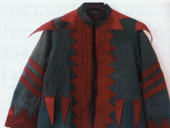
6. Granota de Plens de la Patum de Berga un cop finalitzats els processos de restauració.

U.: Ens podries confessar si tens alguna nineta dels teus ulls quant a tipus d'objectes tèxtils?