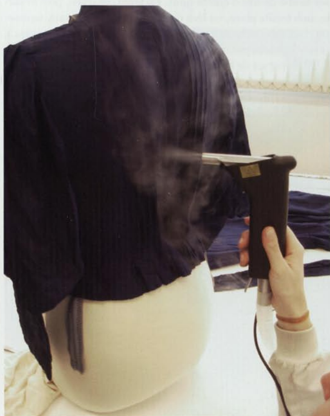
4. Tractament d'humidificació amb vapor fred per a l'eliminació de plecs i arrugues en un vestit de seda del segle XIX.