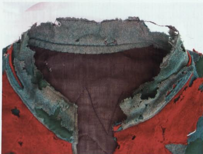
5. Detall d'una granota de Plens de la Patum de Berga abans de la intervenció de restauració.

D'altra banda, també m'encarrego de les restauracions, tant pròpies del CDMT com de les externes, ja vinguin de clients privats com d'altres institucions.