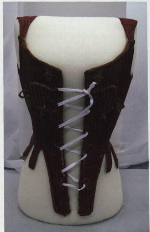
8. Exemple de suport fet a mida amb material de conservació per a indumentària.

E.C.: Jo crec que és un tema d'educació de la gent. Crec que cada vegada més, no només nosaltres sinó també moltes altres entitats, intentem educar, ja sigui parlant o explicant, que el teixit també és art, que també s'ha de conservar i restaurar. No pel fet que hagi estat un objecte funcional, no s'ha de restaurar. Penseu que cada vegada hi ha més particulars que tenen interès per recuperar i cuidar aquella indumentària de la seva àvia per tal de passar-la als seus néts o als fills dels seus néts. Cada vegada hi ha més persones que donen valor al teixit.