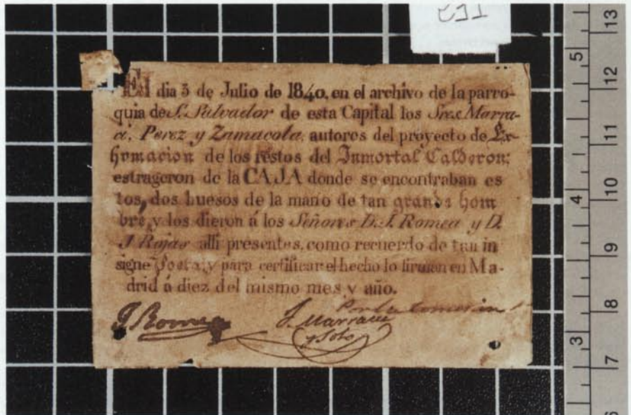
Imprés signat de petites dimensions, situat a la part inferior del conjunt, que certifica la donació de dos ossos del poeta al 1840.

Creiem que podem estar satisfets doncs els alumnes han comprovat que la interdisciplinarietat no és sols un recurs teòric com a criteri si no que es pot dur i cal portar-lo a la pràctica doncs és fonamental per a poder intervenir correctament sobre el nostre patrimoni. Extrapolat el bagatge assolit en les experiències multidisciplinars i aplicar-lo en les pràctiques és un dels objectius de totes les programacions del Seminari de Conservació-Restauració. Els coneixements obtinguts en l'especialitat i a l'hora saber col·laborar amb especialistes d'altres disciplines ajuden a actuar de forma interdisciplinària, assegurant així criteris ben fonamentats en tota intervenció sobre béns culturals.