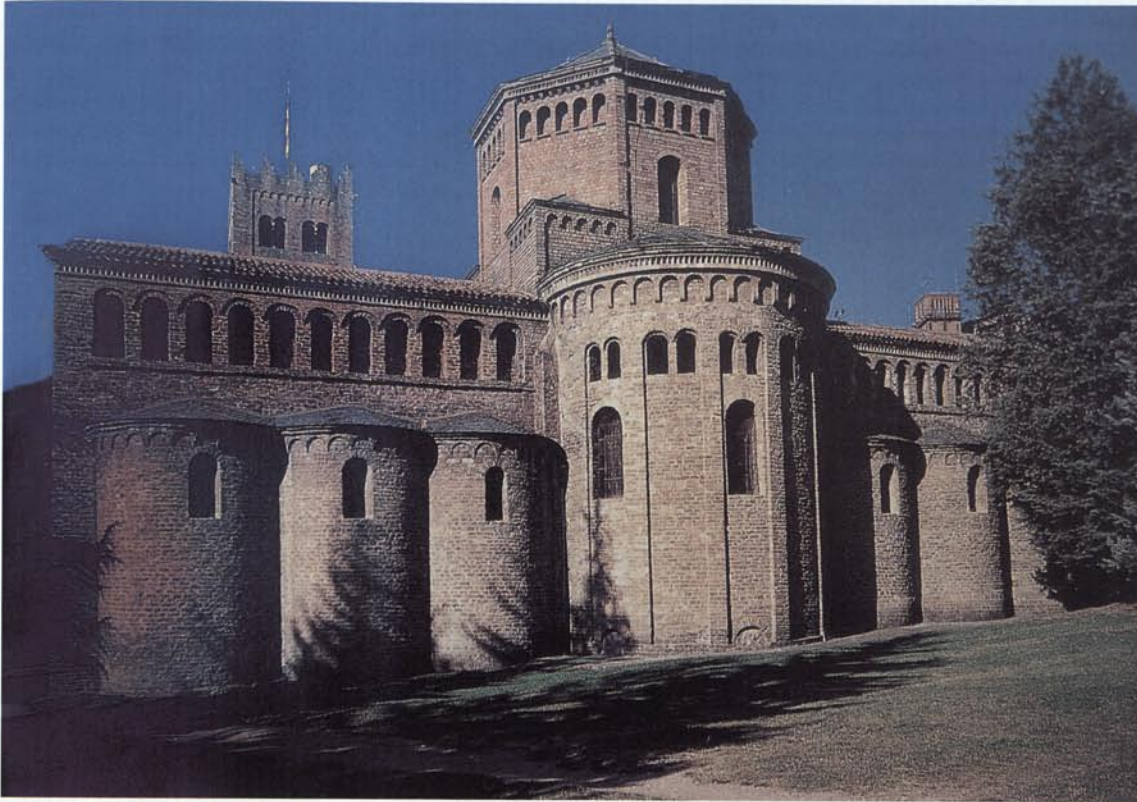
Estat actual de la capçalera de la basílica de Santa Maria de Ripoll.

Durant aquests anys el monestir es consolidà com un símbol de Catalunya, en la restauració del qual hi intervingueren els ciutadans i els estaments del país. Així, l'any 1863 cent-cinquanta voluntaris participaren en una campanya de consolidació dels murs del monument i l'any següent, davant de la retallada de les inversions estatals, les diputacions de Girona, Barcelona i Lleida aportaren diners per a la reconstrucció del monestir, i s'aconseguien també donatius per subscripció popular. No obstant, a mesura que la reconstrucció del monestir esdevenia una metàfora de la reconstrucció de Catalunya, s'evidenciaven els conflictes interinstitucionals, sobretot pel que fa a l'Acadèmia de San Fernando que sovint demanava explicacions a la comissió provincial de Girona perquè actuava sense consultar-la.