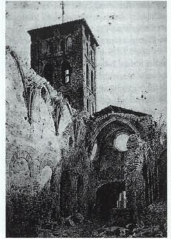
Vista de la basílica de Santa Maria de Ripoll abans de la restauració, segons aquarel·la de Francesc Soler i Rovirosa.

A la llarga, aquesta actitud propera a la “restauració arqueològica” degué influir a Elies Rogent, ja que en el segon projecte sembla preferir l'arqueologia a les tesis violetianes, optant per un criteri eclèctic, a mig camí entre el que ell anomena teories racionalistes i la lliure creació filla de la fantasia de l'artista. Un criteri que qualificà com a “artístico-arqueològic” i que malauradament no va definir.