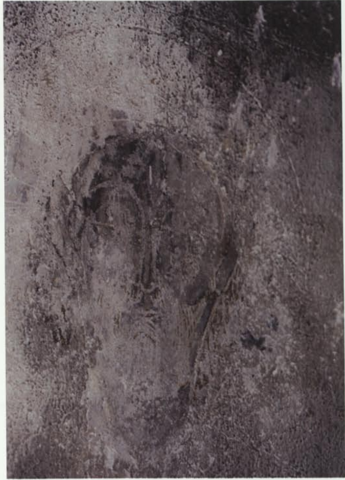
Detall del rostre de Jesús a l'escena del Sant Sopar.

Al mateix temps, va ser necessari realitzar processos de fixació i consolidació puntuals en les zones on hi havia risc de pèrdua imminent tant de policromia com d'arrebossat, i es van fer engasats de protecció per prevenir despreniments d'arrebossats amb restes originals, sobretot en la part de l'absis.