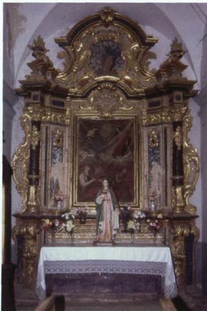
3. Altar de la Mare de Déu del Carme (2)