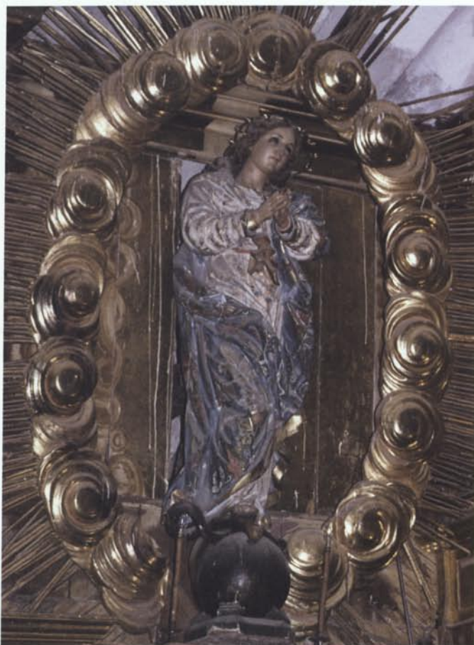
11. Imatge de la Immaculada Concepció de l'altar major.

precia que l'escultor serva més fidelitat al barroc, 32 car és una peça que, com l'Assumpció de Josep Sunyer de l'altar major d'Igualada, executada uns quaranta anys abans, 33 pot situar-se a mig camí entre la Immaculada primerenca de Verdú (obra d'Agustí Pujol II, 1623) i la tardana de Cervera (obra de Jaume Pedró, 1787). 34 Tanmateix, la de Palau, tot i repetir el moviment ondulat ascendent que caracteritza la d'Igualada, presenta major suavitat i menys duresa en la talla en general, sobretot la dels plecs de la roba. Potser per això sembla més propera als prototipus divulgats per Murillo un segle abans. 35