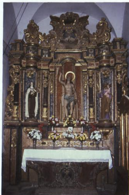
5. Altar de Sant Sebastià (4).

La visita prioral de 1703 parla del temple parroquial antic que fou enderrocat en construir l'actual. 16 Era més petit, ja que només tenia quatre altars (el Major, el del Sant Crist, el de Sant Esteve i el de Sant Salvador) i un campanar –probablement d'esppanya– amb quatre campanes.