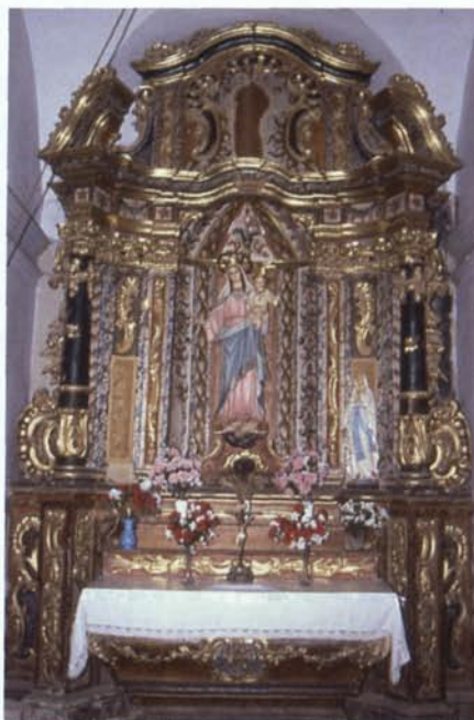
6. Altar de la Mare de Déu del Roser (5).