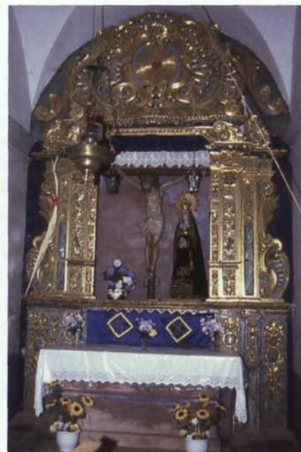
7. Altar del Sant Crist (6).