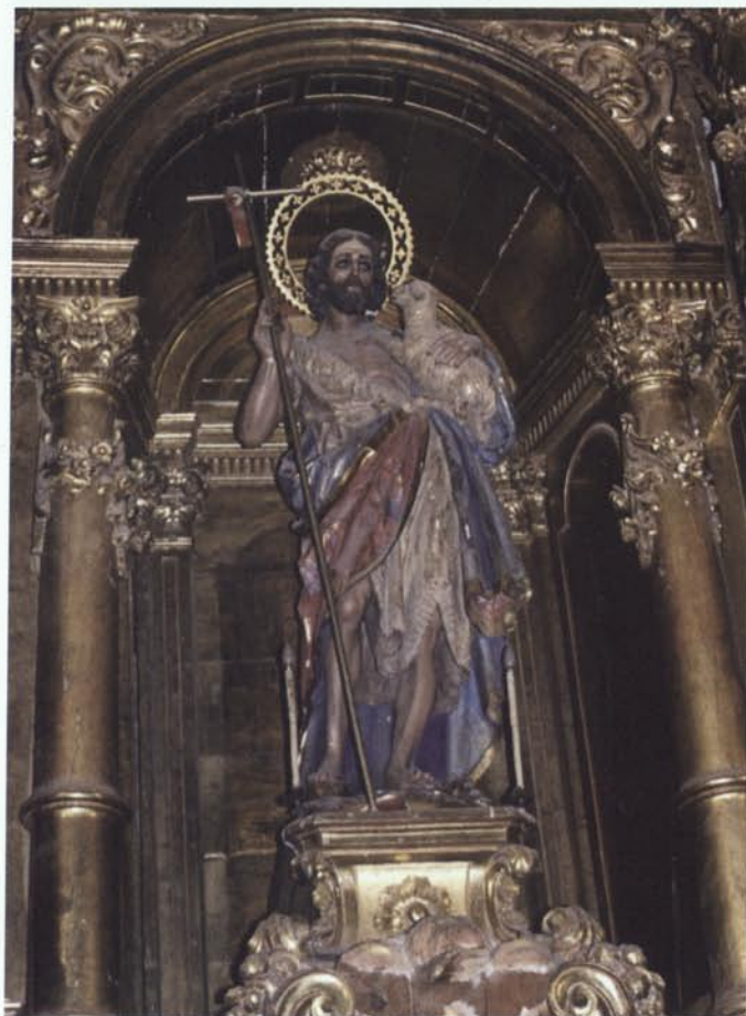
12. Imatge de Sant Joan Baptista de l'altar major.