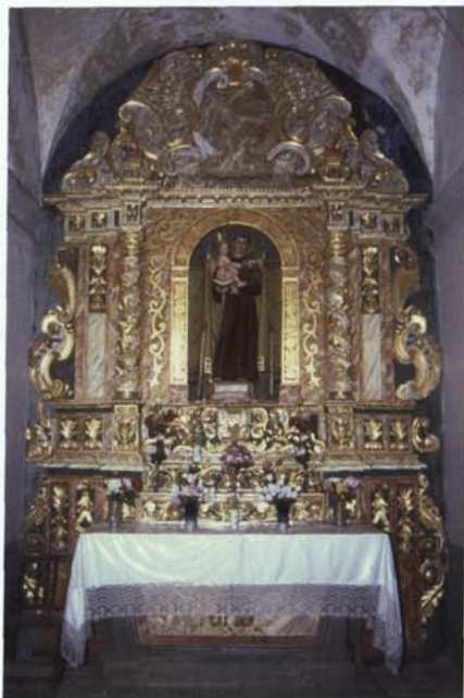
2. Altar de Sant Antoni (1).