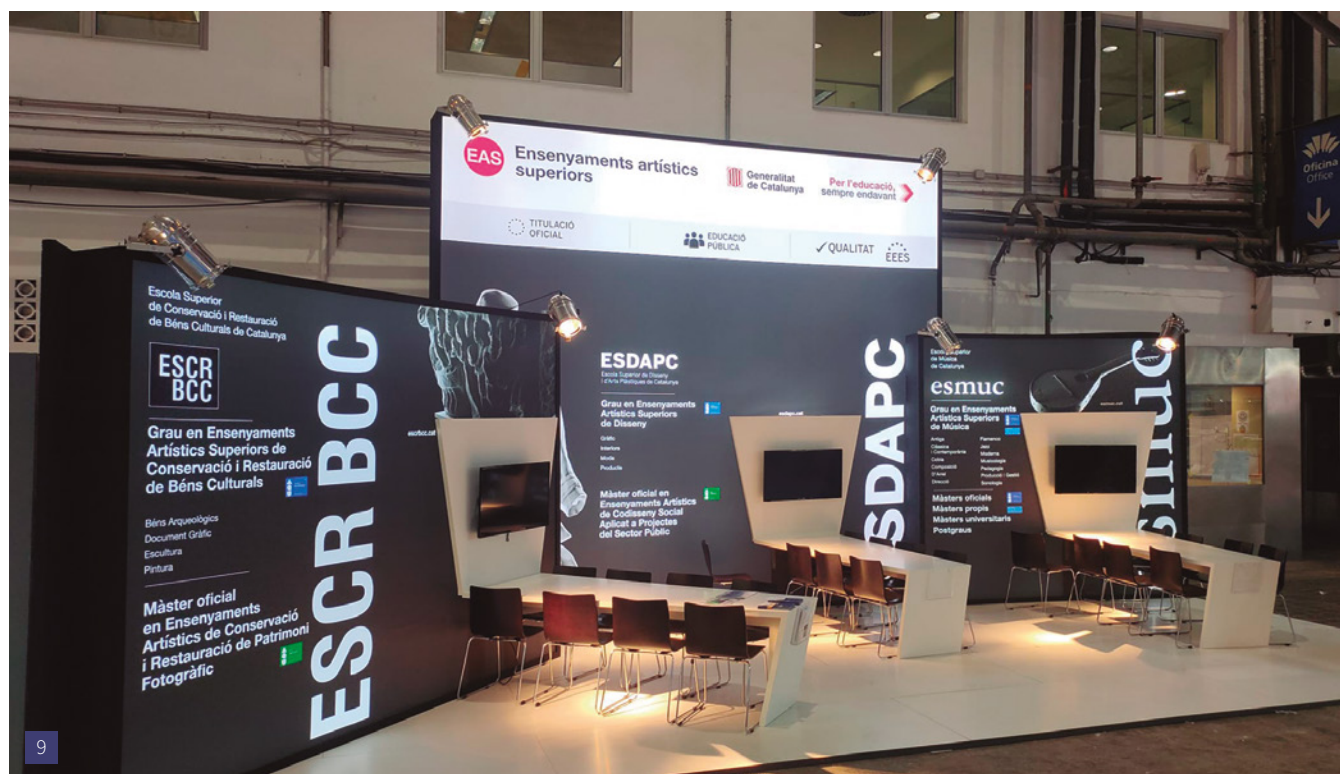
[9] Estand de l'ESCRBCC al Saló d'Ensenyament 2023.

D'altra banda, el desembre de 2022 l'ESCRBCC va participar a la sisena edició de la Fira de l'Estudiant a l'Institut Dertosa a Tortosa i, finalment, el març de 2023 l'ESCRBCC va participar a la 23a edició de l'Espai de l'Estudiant de Valls, concretament a la sala Kursaal, on hi havia 61 expositors que varen ser visitats pels instituts de la província de Tarragona. 9