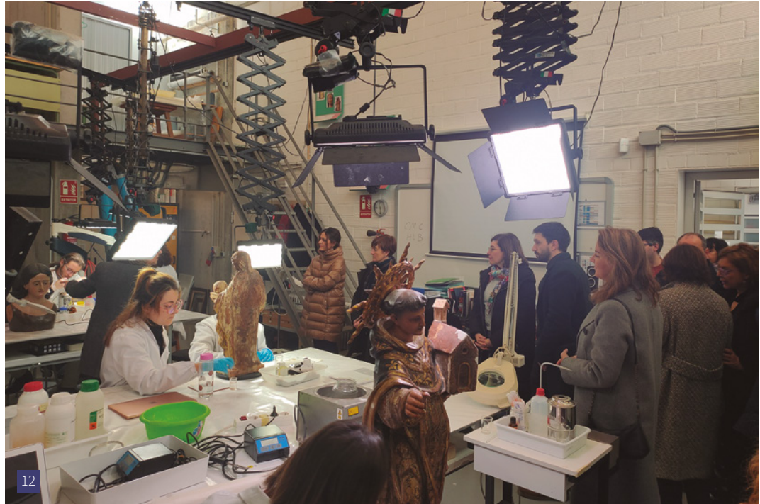
[12] Diputades i diputats de la Comissió d'Educació i Formació Professional del Congrés dels Diputats visitant les instal·lacions de l'ESCRBCC.

El dia 1 de març de 2023 diputades i diputats de la Comissió d'Educació i Formació Professional del Congrés dels Diputats van visitar l'ESCRBCC en el marc de les visites que l'esmentada comissió va realitzar a diverses comunitats autònomes per tal de conèixer de primera mà la realitat dels centres que imparteixen Ensenyaments Artístics Superiors a l'estat espanyol, amb l'objectiu d'analitzar, enriquir i millorar la nova Llei d'Ensenyaments Artístics Superiors, després de la publicació de l'avantprojecte de llei aprovat pel Consell de Ministres el passat 21 de