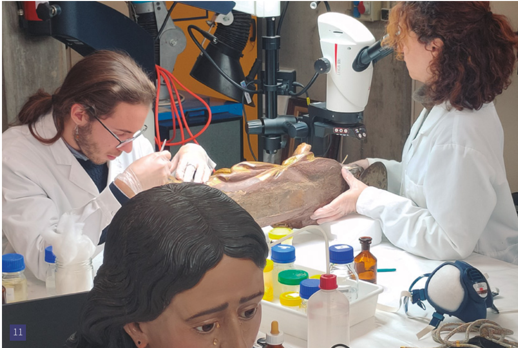
[10] Estudiants del Grau de Conservació i Restauració de Béns Culturals de l'ESCRBCC.

El juliol de 2022 AQU Catalunya va publicar els resultats de l'enquesta de satisfacció de les persones que van obtenir el títol de grau o de màster en els Ensenyaments Artístics Superiors (EAS) durant els cursos 2018-2019, 2019-2020 i 2020-2021. Pel que fa a l'ESCRBCC, hi va participar un 53,5% de tots els graduats i graduades del Grau de Conservació i Restauració de Béns Culturals i un 69,2% de les persones titulades en el Màster en Conservació i Restauració de Patrimoni Fotogràfic.