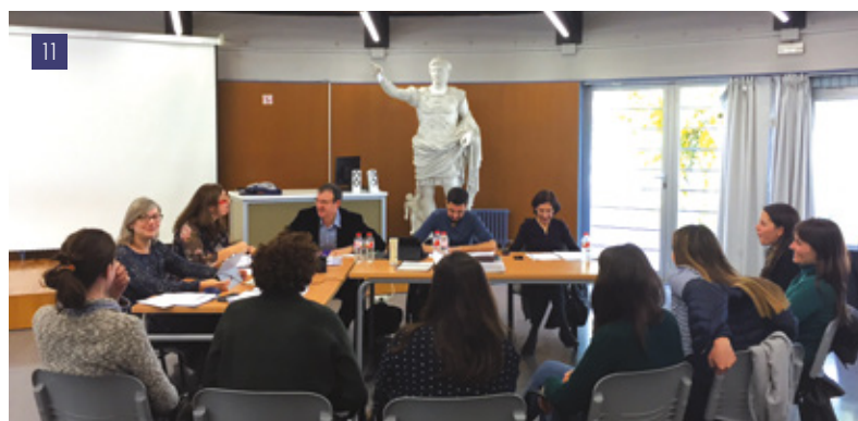
[11] El Comitè d'Avaluació Externa designat per l'Agència per a la Qualitat del Sistema Universitari de Catalunya entrevistant-se amb graduats de l'ESCRBCC el 9 de novembre de 2017.

Dins del procés d'acreditació del Títol Superior de Conservació i Restauració de Béns Culturals que s'imparteix a l'ESCRBCC el passat 9 de novembre de 2017 el Comitè d'Avaluació Externa designat per l'Agència per a la Qualitat del Sistema Universitari de Catalunya va visitar el centre. El Comitè estava presidit per Salvador Muñoz Viñas (Universi-