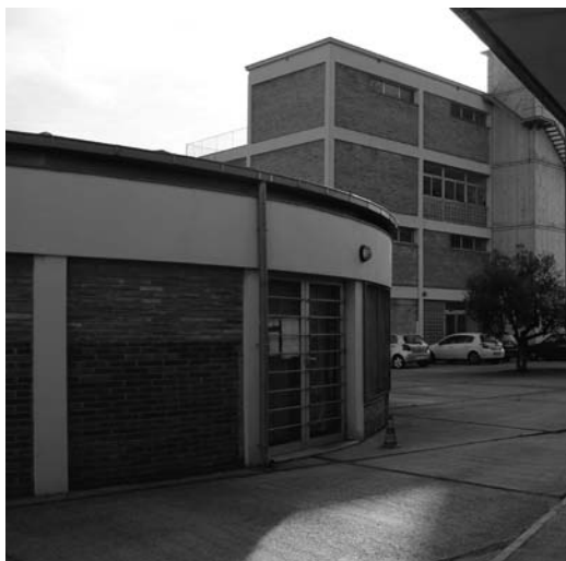
Vista general de la escuela en 2011. [pág.6]

Fecha de recepción: 15-IX-2011 / Fecha de aceptación: 19-IX-2011