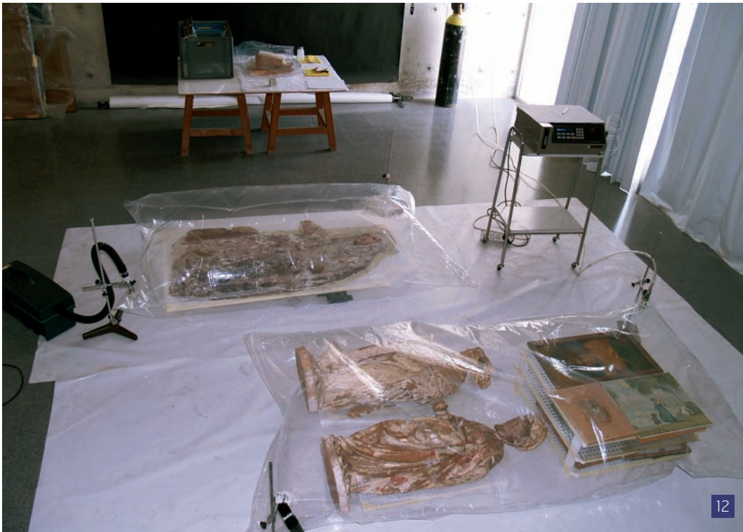
[12] Tractament d'anòxia en diferents tipologies de peces (obra gràfica, escultures i una pintura sobre tela) afectades per biodeterioració.

conservació-restauració en exercici. En aquesta línia, l'ESCRBCC va arribar l'any passat a un acord amb l'Associació de Conservadors i Restauradors de Catalunya (ARCC) per tal que els seus associats puguin gaudir d'aquest servei.