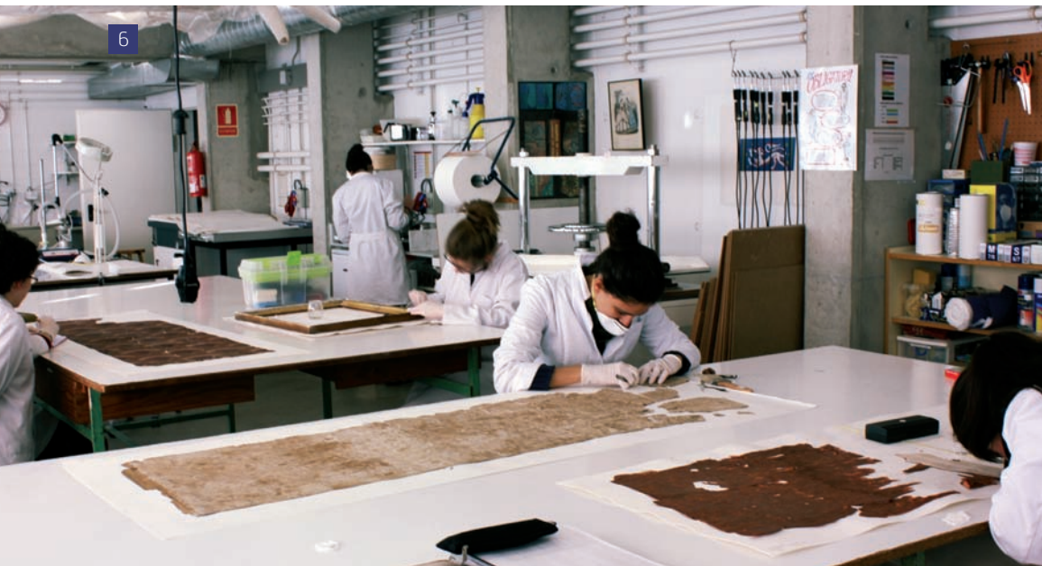
[6] Alumnes de l'especialitat de Conservació i Restauració de Document Gràfic durant la intervenció d'obra gràfica emmarcada i de papers pintats. Promoció 2008-2011.

Des d'un bon començament la legislació vigent va establir una ràtio reduïda per a aquests ensenyaments: 10 alumnes per especialitat. Aquest fet suposà 40 alumnes per curs i 120 alumnes anuals, ja que fins ara a l'ESCRBCC s'han impartit quatre especialitats dins d'un pla d'estudis de tres anys de durada: conservació i restauració de béns arqueològics, conservació i restauració de document gràfic, conservació i restauració d'escultura i conservació i restauració de pintura.