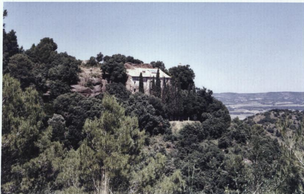
2. Vista general de l'ermita de Sant Joan de Montblanc després de les darreres tasques de rehabilitació fetes per l'associació "Ermítans de Sant Joan".

monestir de Santa Maria de Poblet, una altra obra clau en la seva trajectòria, que significà una aposta decidida envers el llenguatge renaixentista. 4