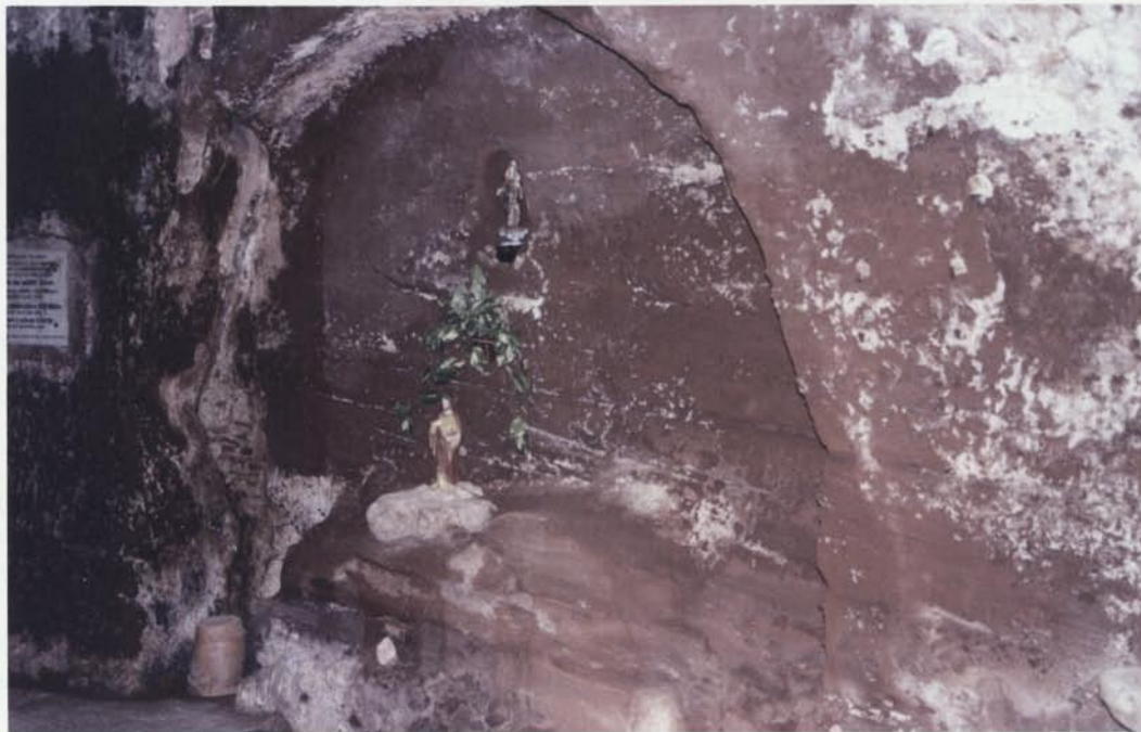
5. Altar lateral dret de l'ermita amb dues imatges de guix de la Mare de Déu i de Sant Josep, el mes de juliol de 2004.