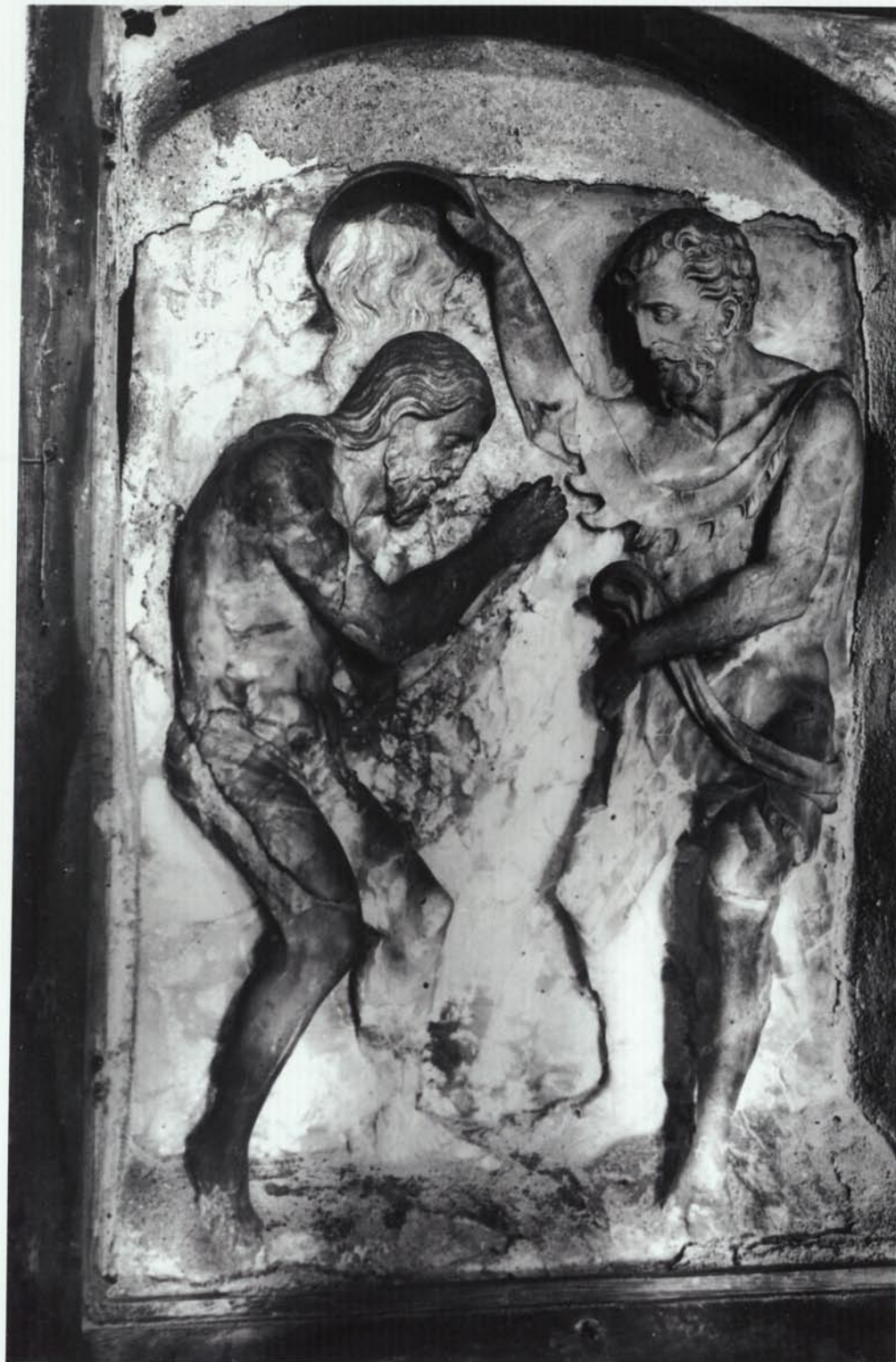
6. Relleu original del Baptisme de Jesús atribuït a Damia Forment, segons una fotografia de l'any 1918, quan estava ubicat a l'altar principal de l'ermita (Fotografia: Institut Amatller d'Art Hispànic de Barcelona, clixé núm. C-23.568).

Zaragoza: Diputación General de Aragón, 1996. En aquesta publicació, d'altra banda, hi trobareu dos interessants estudis: un sobre la història del retaule i l'altre sobre la seva restauració.