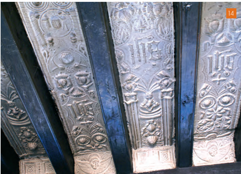
[13] Figures al·legòriques de serafins, garlandes i galls fers, al sostre del sotacor de l'església parroquial de Sant Sadurní de la Pedra (La Coma i la Pedra).