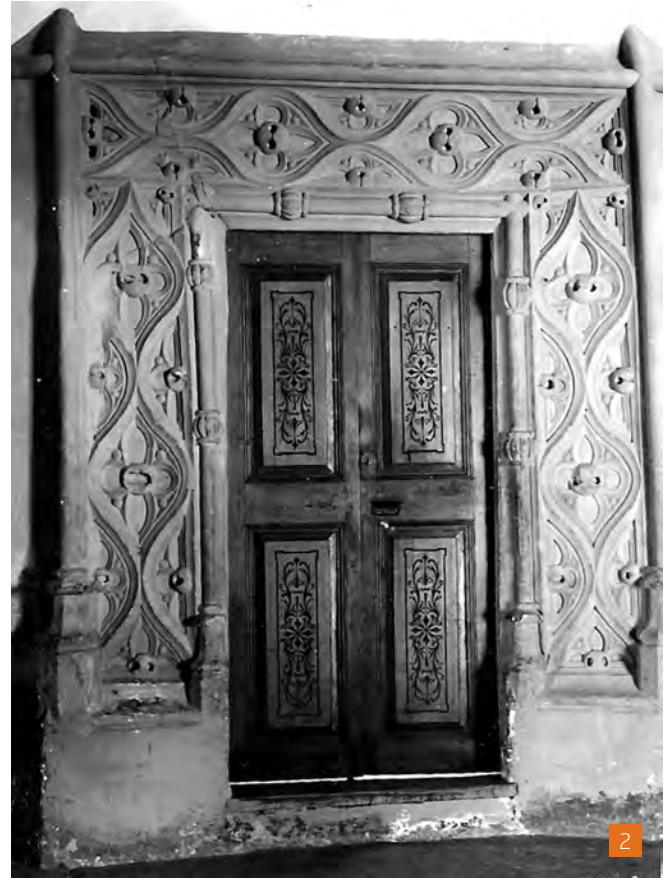
[1] Portalada amb arc el·líptic rebaixat, a la sala noble del primer pis del monestir de Sant Llorenç de Morunys.