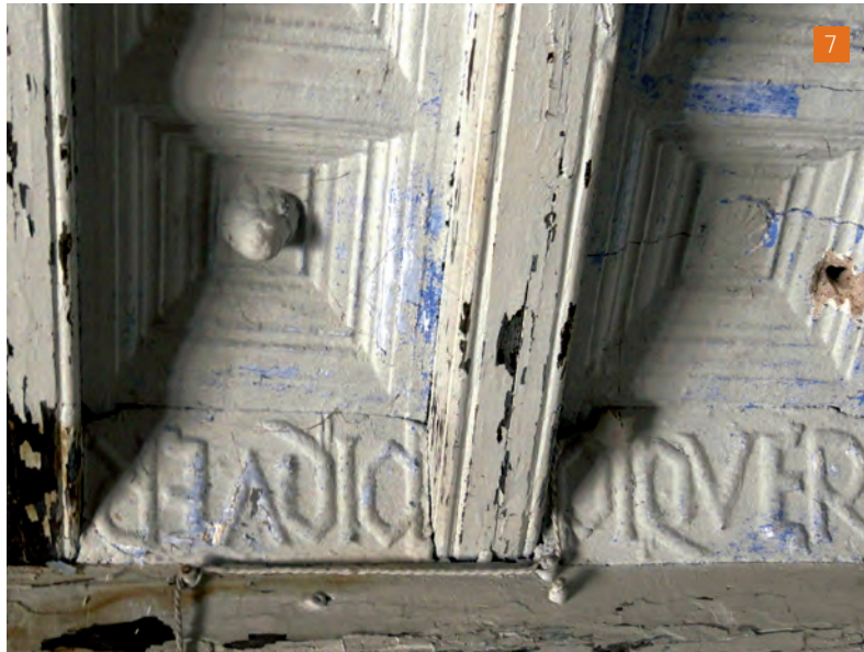
[7] Cassetons emmotllurats amb floró central i entrebigats amb el nom "PIQVER", del revés i del dret, a la planta baixa del monestir de Sant Llorenç de Morunys.

Aquest sostre correspon al segle XVI. S'observen dos tipus d'emmotllats, resultat de la utilització de dos motlles diferents. Aquests haurien de tenir una llargada total de 2,10 m.