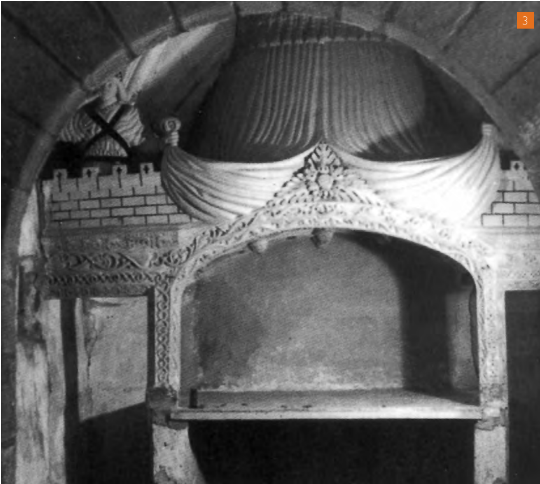
[3] Altar del sepulcre de la capella de la Pietat, a Sant Llorenç de Morunys, vist a través de l'arc lateral que dona accés al sepulcre.

A les sales de les cases, els propietaris de les quals eren persones acabalades, o a les d'alguns edificis públics, laics o religiosos on es pretenia prestigiar un determinat àmbit, es va utilitzar amb molta freqüència la tècnica del guix emmotllat.