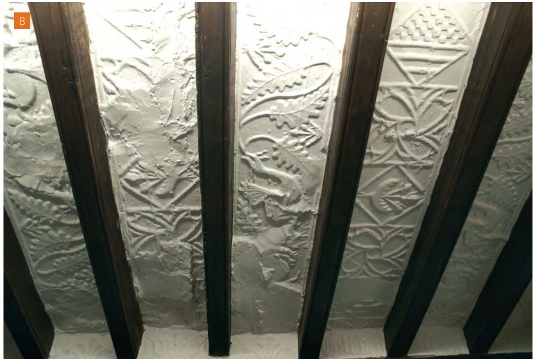
[8] Dracs capiculats amb fulles de roure i escuts i molinets, al sostre del primer pis de la casa de la Vila (ajuntament vell) de Sant Llorenç de Morunys.

el floró descentrat i la figura d'animal de dues cames, d'identificació incerta.