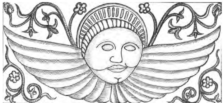
[15] Reproducció parcial d'un entrebigat, amb el rostre esquematitzat d'un querubí coronat, existent al sostre d'una sala, a les Cases Altes de Posada (Navès) (Dibuix: Joan Herrada).