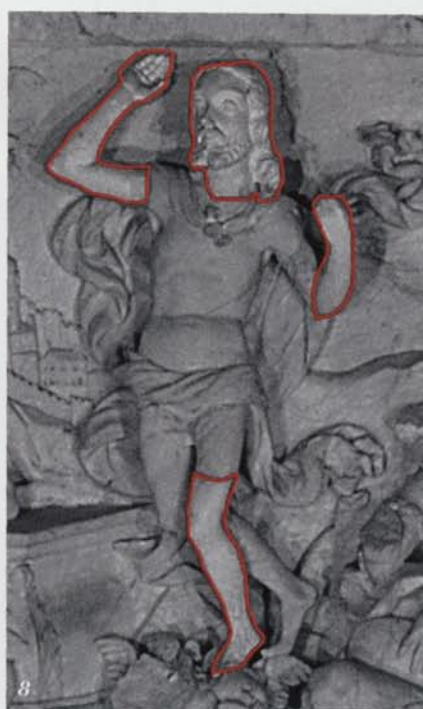
6, 7 i 8. Reintegració de les escultures situades, respectivament, a l'àtic i al primer pis del retaule de l'altar major de Poblet, i del Crist del relleu de la Resurrecció (Fotografies: C. Aymerich, CRBM; retoc gràfic: M. Artigau).