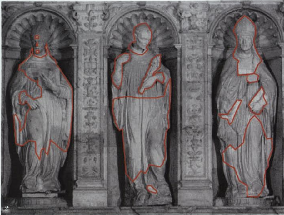
2 i 3. Escultures del primer pis del retaule de Poble talle, col·locades en la intervenció de 1948. Les línies vermelles indiquen les zones reconstruïdes en guix per l'escultor Modest Gené, per tal de diferenciar-les dels fragments d'alabastre (Fotografies: C. Aymerich, CRBM; retoc gràfic: M. Artigau).