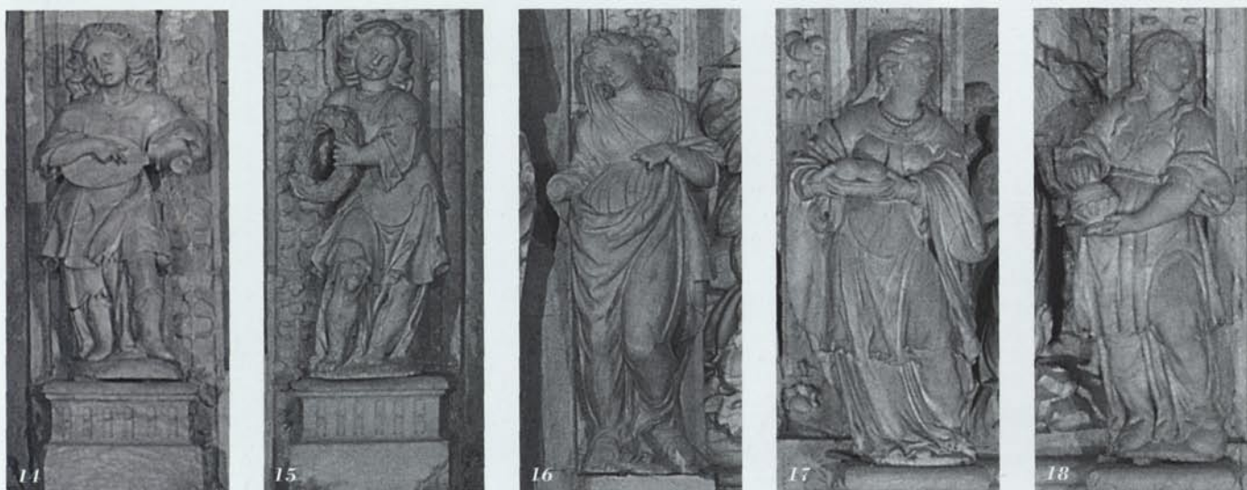
14, 15, 16, 17 i 18. Escultures col·locades a les pilastres del primer i segon pis del retaule de Poblet en la intervenció de 1948, sense realitzar-hi cap tipus de reconstrucció.

Quant a les sis escultures restants col·locades al retaule, totes varen ser reconstruïdes, així com la imatge de la Mare de Déu