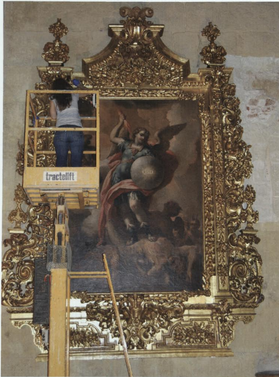
11. Ubicació al lloc d'origen i supervisió del muntatge del retaule-marc de sant Miquel.