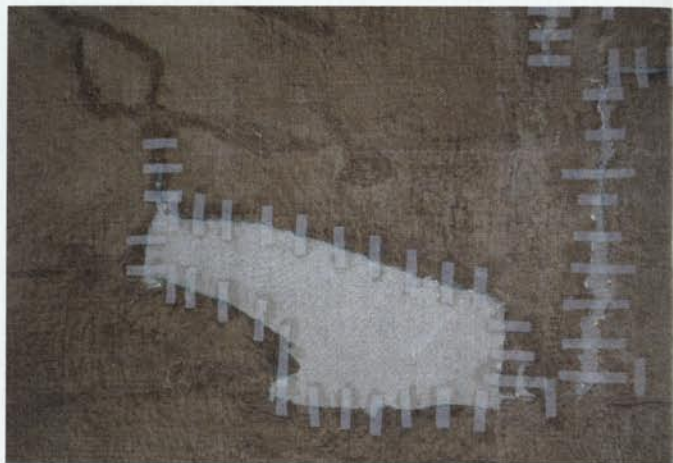
6. Detall del revers del llenç. Consolidació del teixit del suport mitjançant grapes i empelts.