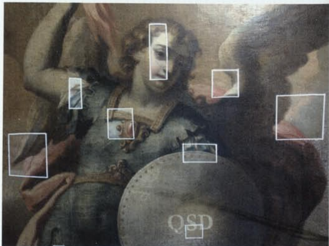
7. Detall del llenç durant el procés d'eliminació del vernís. Testimoni de neteja.