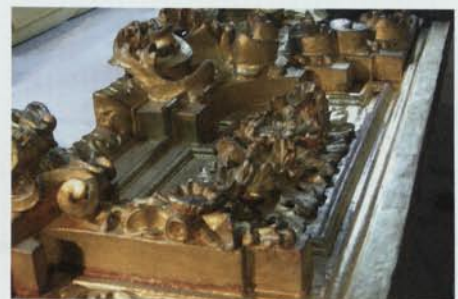
4. Detall de la predel·la durant el procés de reintegració cromàtica del daurat.