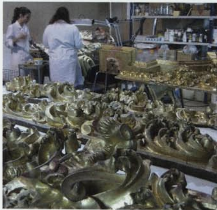
3. Treballs d'intervenció al taller. Reintegració volumètrica i estucat.