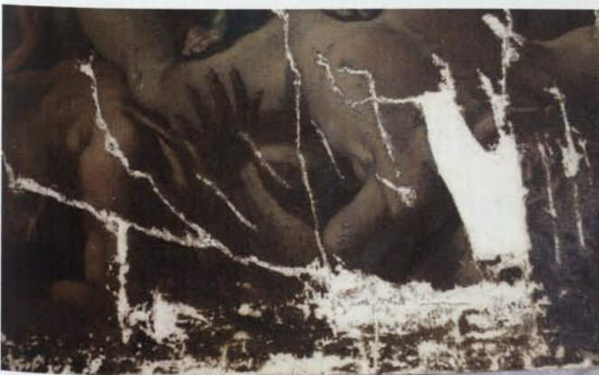
9. Detall. Procés d'estucat del llenç.