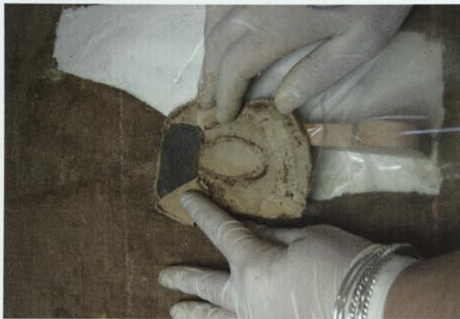
5. Pedaç metàl·lic d'intervenció anterior trobat durant el procés d'intervenció.