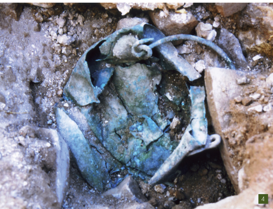
[3] Fotografia de finals del segle XIX que mostra, principalment, els objectes de bronze recuperats l'any 1864 al pou Cartanyà. [4] Vista d'una de les sítules trobades al pati de la domus, in situ.

nents. Durant el seu ús, un nombre considerable es van despendre de la corda i van caure al fons de l'estany, en un moment imprecís que podem situar entre finals dels segles III i V. 3