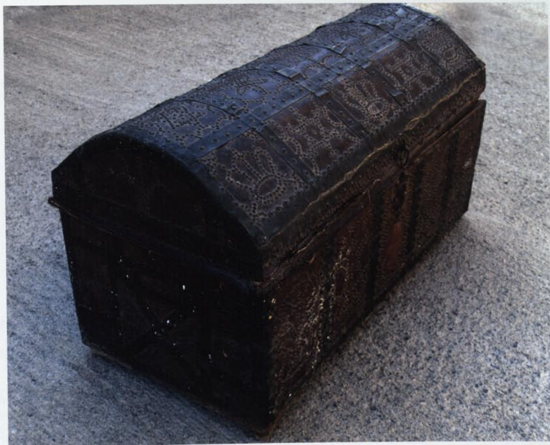
1. Visió general del bagul on es pot apreciar la decoració dels plafons de pell amb motius vegetals i geomètrics.

Des del punt de vista decoratiu, l'esquema ornamental s'adapta perfectament a l'estructura funcional, segons es tracti de la tapa o les diferents cares del cos de la caixa. En conjunt, cada cara es divideix en plafons, compartimentats per bandes metàl·liques, que també serveixen de reforç als angles. A la cara frontal hi ha cinc plafons de forma rectangular vertical. Als